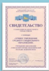
Лучший колледж г. Гомеля 2015 г.