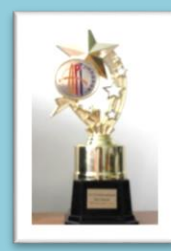
Победитель Республиканского фестиваля «АРТ-вакации 2015»