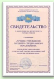
Лучший колледж г. Гомеля 2015 г.