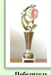
Победитель Республиканского фестиваля «АРТ-вакации 2013»