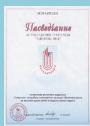
Почетный знак Белкоопсоюза 2001 г.