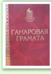
Почетная грамота Белкоопсоюза 2004 г.