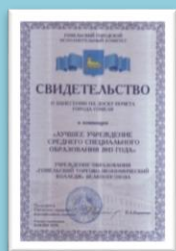
Лучший колледж г. Гомеля 2014 г.

(Колледж основан в 1940 году. 80 лет осуществляет подготовку кадров для Республики Беларусь)