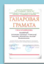
Почетная грамота Белкоопсоюза 2018 г.