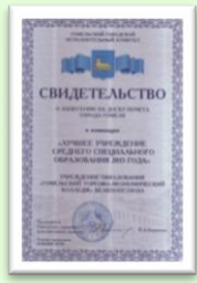
Лучший колледж г. Гомеля 2014 г.

(Колледж основан в 1944 году и осуществляет подготовку кадров для Республики Беларусь более 70 лет)