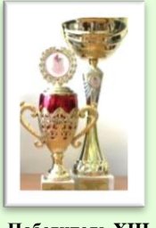
Победитель XIII Республиканской спартакиады 2015 г.

Приём в 2017 году осуществляется по следующим специальностям: