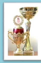
Победитель XIII Республиканской спартакиады 2015 г.

Приём в 2021 году осуществляется по следующим специальностям: