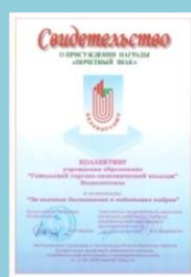
Почетный знак Белкоопсоюза 2020 г.