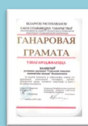
Почетная грамота Белкоопсоюза 2004 г.